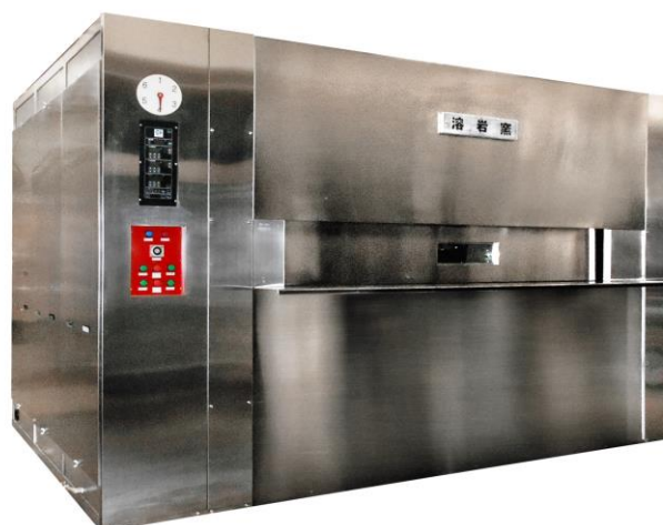
焼成室(天井・壁・床)に溶岩石を使用

最大の特徴は、焼成室(天井・壁・床)に溶岩石を使用して遠赤外線の発生を 最大化して高温・短時間で焼き上げる結果、食べ物のお味しさにつながる水分の 減少率を少なく、水分が多く残るということは味と香りの成分が多く残り、パンの 美味しさを持続させます。